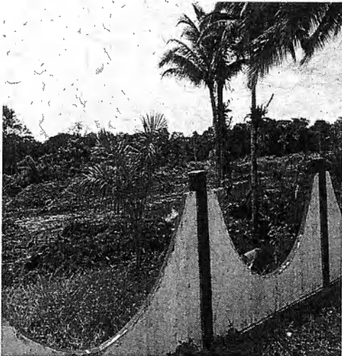
Foto 1. Esta foto muestra cómo se ve desde afuera la intervención en el lote.