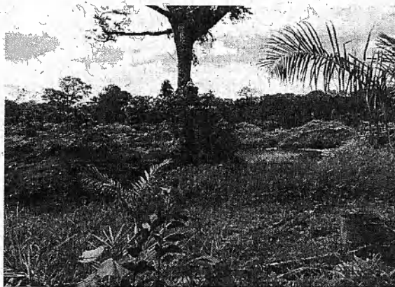
Foto 3. Esta muestra cómo se ve desde afuera la piscina.