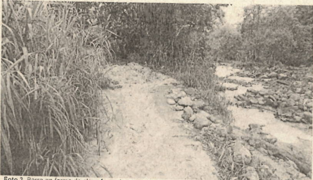
Foto 3. Barra en forma de playa formada por la desviación del caudal solido de la quebrada El Janeiro.

“POR MEDIO DEL CUAL SE REMITE POR COMPETENCIA PROCEDIMIENTO SANCIONATORIO AMBIENTAL”