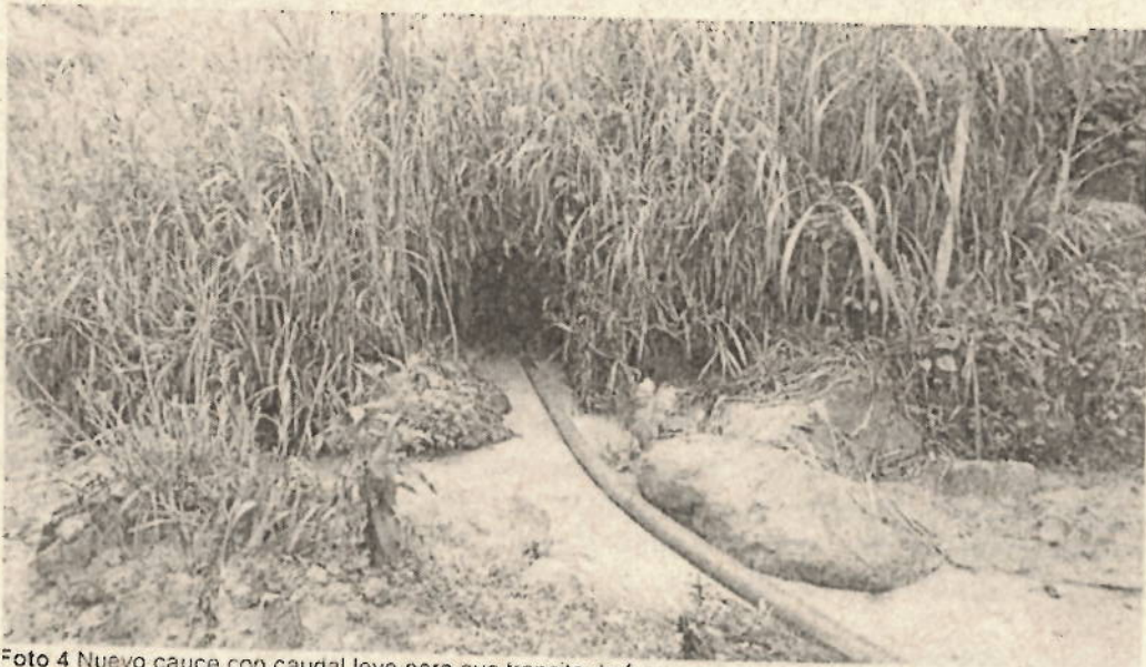
Foto 4 Nuevo cauce con caudal leve pero que transita de forma constante desde la quebrada El Janeiro.