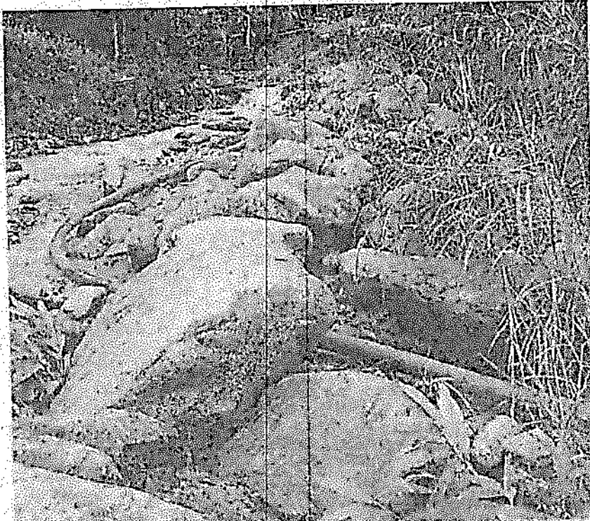
Foto 1. Tubería flexible de aducción para extraer caudal líquido y sólido de la quebrada El Janeiro

“POR MEDIO DEL CUAL SE REMITE POR COMPETENCIA PROCEDIMIENTO SANCIONATORIO AMBIENTAL”