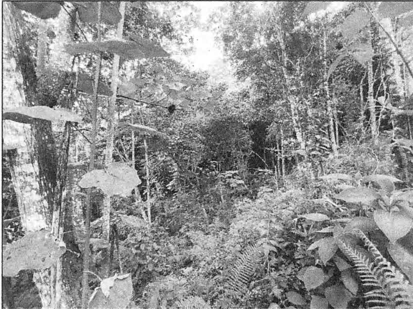
Fotografía 1. Ubicación del predio.

Se realizan dos (2) intentos de entrega de la Notificación por aviso del oficio 0713-825212023, sin embargo, no ha sido posible realizar dicha entrega debido a que el predio no cuenta con vivienda.