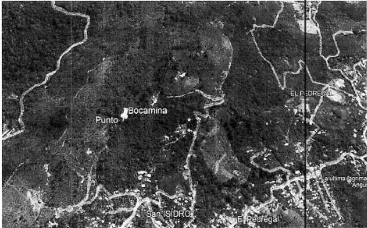
Imagen donde se muestra la ubicación del punto según coordenadas de los oficios .

Corporación Autónoma Regional del Valle del Cauca