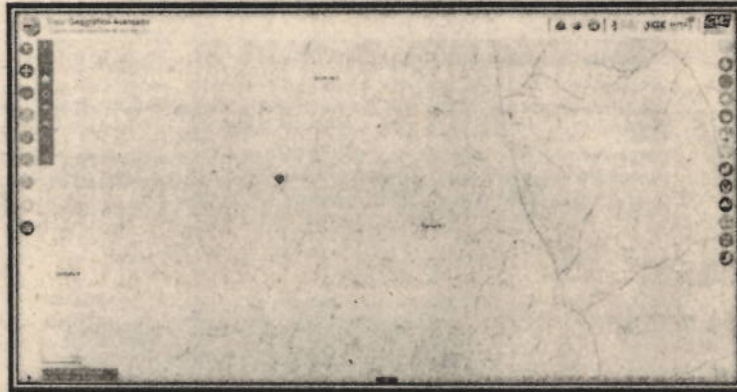
Figura 1 Ubicación procedimiento.