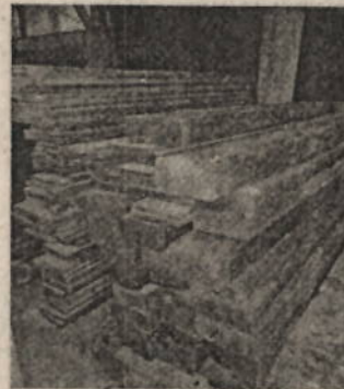
Imagen 1 Productos dispuestos temporalmente en el CAV de flora de la CVC DAR Centro Sur, bodega Guadalajara San Pedro.

Según el informe recibido, mediante actividades de vigilancia y de control, el Grupo de Protección Ambiental y Ecológica del municipio de Guadalajara de Buga, en la carrera 6 entre calles 8 y 9, donde se observa estacionado en vía pública un vehículo tipo de placas JIA 718, color verde, al revisar el vehículo se encontraron 101 unidades de madera en etapa de transformación teleras y bloques de la especie cedro, equivalentes a un total de 2,9 metros cúbicos, en cuanto el total de piezas ingresadas corresponden a 78 teleras de 2,9m de largo, 0,25m de ancho y 0,025m de alto y 23 bloques de 2,9m de largo, 0,15m de ancho y alto. Al solicitarles el respectivo salvoconducto para el transporte del producto forestal, manifestaron no contar con ningún tipo de permiso emitido por parte de la autoridad ambiental, por lo cual se procedió a realizar el decomiso preventivo de los productos forestales, y a trasladarlos a las instalaciones de la CVC DAR Centro Sur.