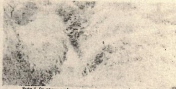
Foto 1. Se observa el punto de vertimiento al cauce de aguas.

“POR LA CUAL SE ORDENA LA CESACIÓN DE UN PROCEDIMIENTO ADMINISTRATIVO SANCIONATORIO AMBIENTAL Y SE DICTAN OTRAS DISPOSICIONES”