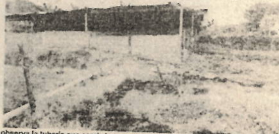
Foto 2. Se observa la tubería que conduce las aguas de lavado y excretas de la explotación porcícola sin ningún tipo de tratamiento previo al cauce de la acequia.

Como aspecto relevante se pudo establecer que la actividad se lleva a cabo en una zona que ha sido vinculada al perímetro urbano del corregimiento, lo que implica una incompatibilidad con el uso del suelo.