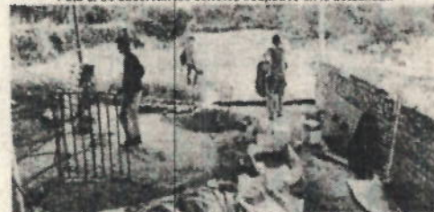
Foto 3. Se observan los corrales en proceso de construcción para la ampliación de las instalaciones.

De acuerdo con lo observado, la alimentación de los animales se utiliza tripa o subproductos de la actividad avícola, aves, lavados o aguamansa y concentrados. No se cuenta con ningún tipo de unidad para el tratamiento de las aguas residuales, lo que implica que tanto las excretas, como la orina de los cerdos y las aguas de lavado son vertidas de forma directa al cauce de la acequia, con lo cual se incumple con la norma de vertimiento establecida en el Artículo 9 de la Resolución 0631 de 2015.