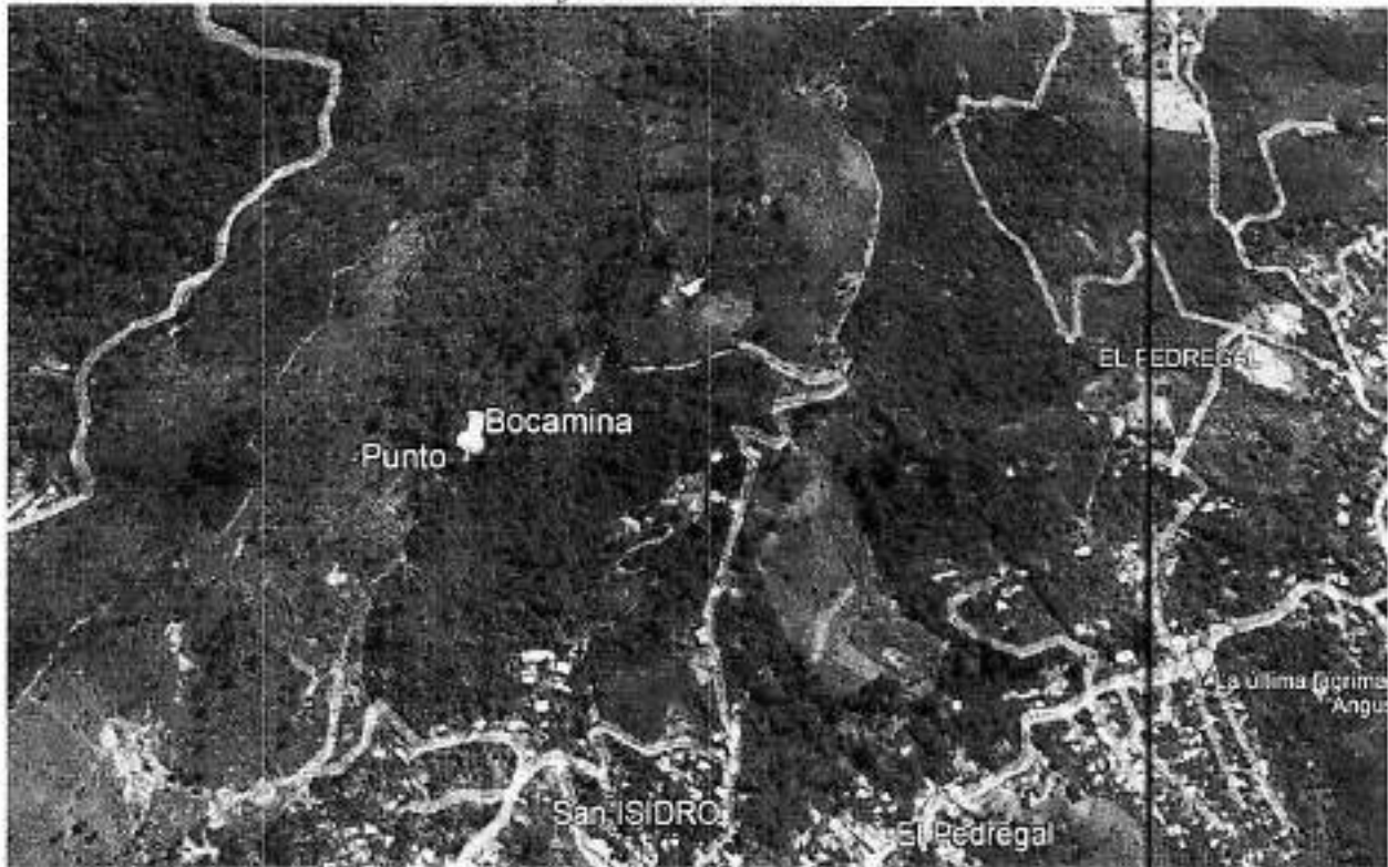
Imagen donde se muestra la ubicación del punto según coordenadas de los oficios.

Corporación Autónoma Regional del Valle del Cauca