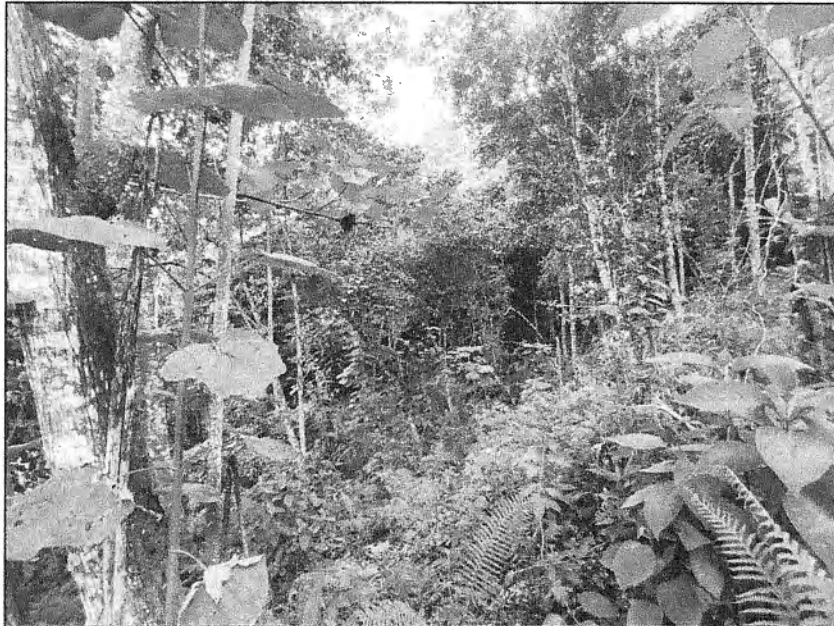
Fotografía 1. Ubicación del predio.

Se realizan dos (2) intentos de entrega de la Notificación por aviso del oficio 0713-825212023, sin embargo, no ha sido posible realizar dicha entrega debido a que el predio no cuenta con vivienda.