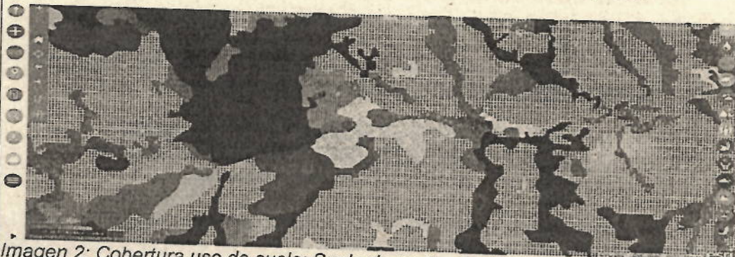
Imagen 2: Cobertura uso de suelo: Suelo de pastos Cultivados

Durante el recorrido no se evidencian nuevas intervenciones en el predio