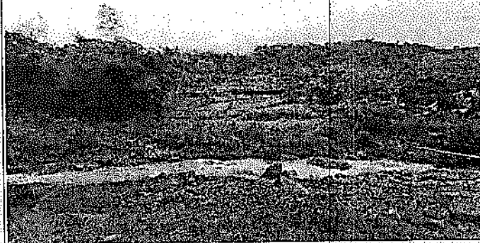
2 Franja forestal protectora de la Quebrada Calabazas