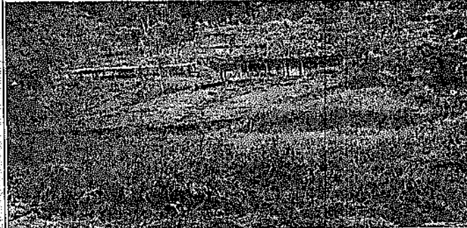
1. Sitio de la explanación

"POR LA CUAL SE CIERRA UNA INDAGACIÓN PRELIMINAR Y SE INICIA PROCESO ADMINISTRATIVO SANCIONATORIO AMBIENTAL"