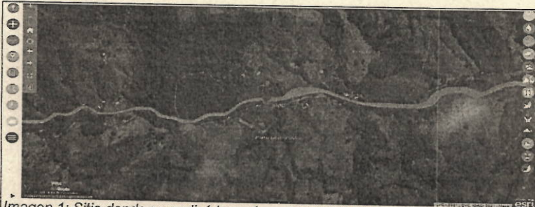
Imagen 1: Sitio donde se realizó la explanación (GEOCVC)