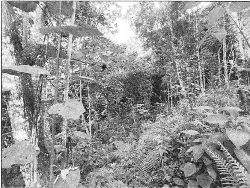
Fotografía 1. Ubicación del predio.

Se realizan dos (2) intentos de entrega de la Notificación por aviso del oficio 0713-825212023, sin embargo, no ha sido posible realizar dicha entrega debido a que el predio no cuenta con vivienda.