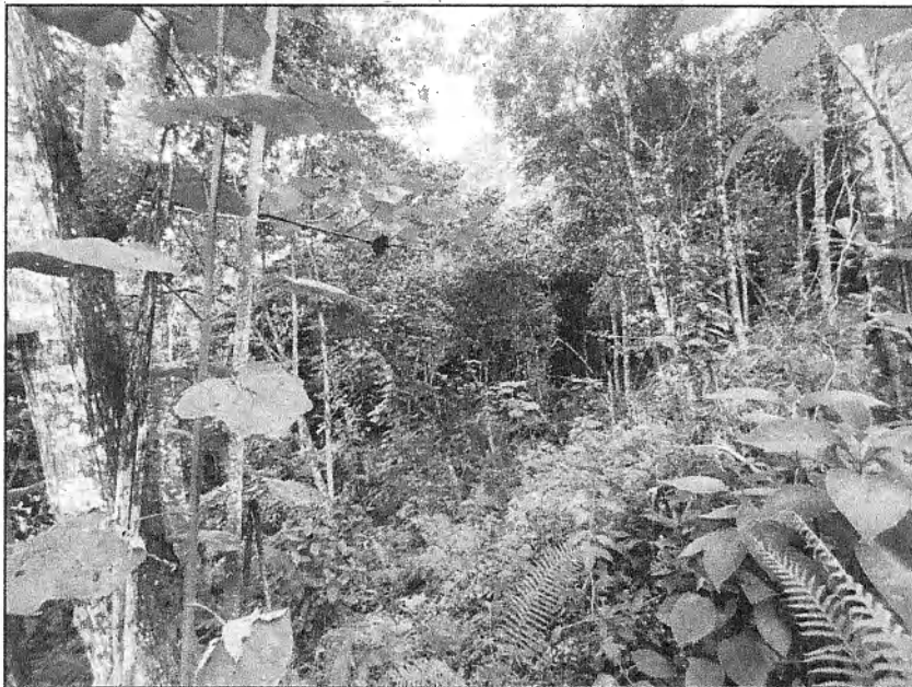
Fotografía 1. Ubicación del predio.

Se realizan dos (2) intentos de entrega de la Notificación por aviso del oficio 0713-825212023, sin embargo, no ha sido posible realizar dicha entrega debido a que el predio no cuenta con vivienda.