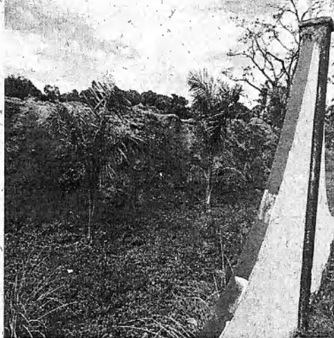
Foto 2. Esta foto da una idea de la cantidad de tierra que se movió en el lugar.