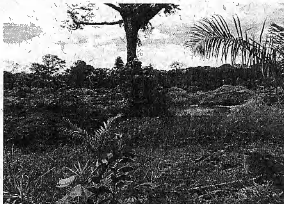
Foto 3. Esta muestra como se ve desde afuera la piscina.