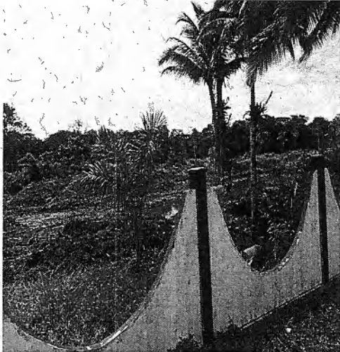
Foto 1. Esta foto muestra como se ve desde afuera la intervención en el lote.