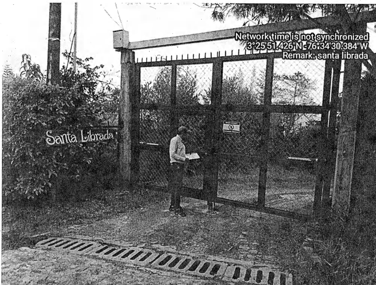
Fotografía 3: ubicación del predio Santa Librada

Por información de los vecinos; se nos informa que nadie atiende a los llamados que se hacen en ese sitio. Que hay una profesora que es compañera de los propietarios del predio y que ella nos puede dar razón.