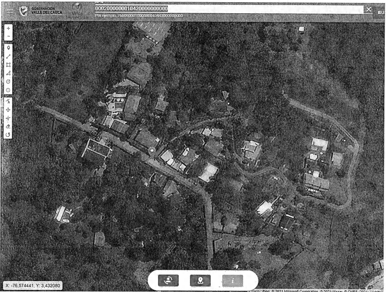
Fotografía 1: ubicación del predio Santa Librada, fuente: Valleavanza 2021.

Coordenadas geográficas: N 3°25'51.426" W 76°34'30.384" del sistema de referencia Magna Sirgas WGS_84.