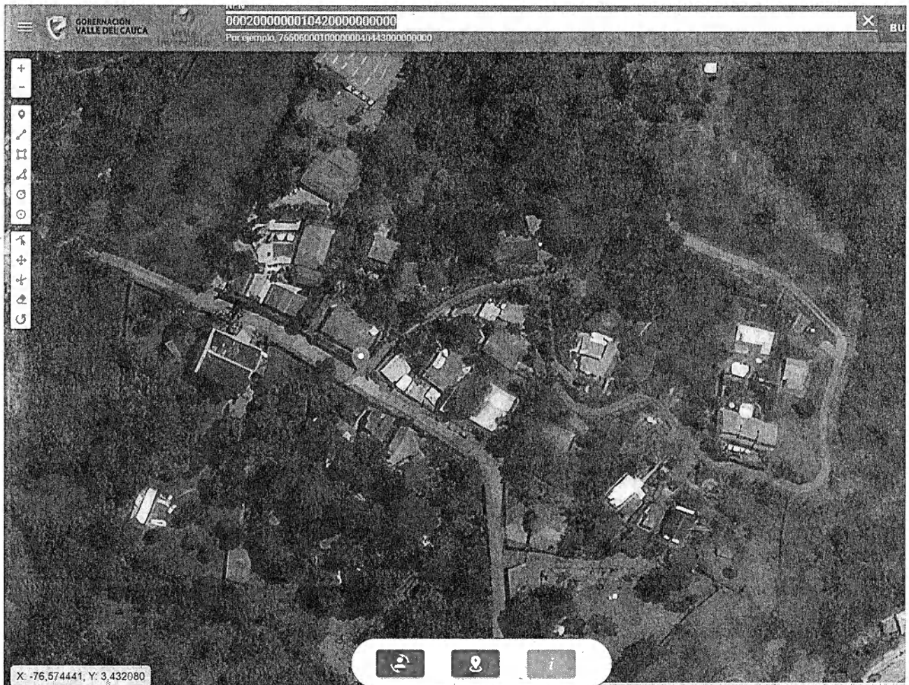
Fotografía 1: ubicación del predio Santa Librada, fuente: Valleavanza 2021.

Coordenadas geográficas: N 3°25'51.426" W 76°34'30.384" del sistema de referencia Magna Sirgas WGS_84.