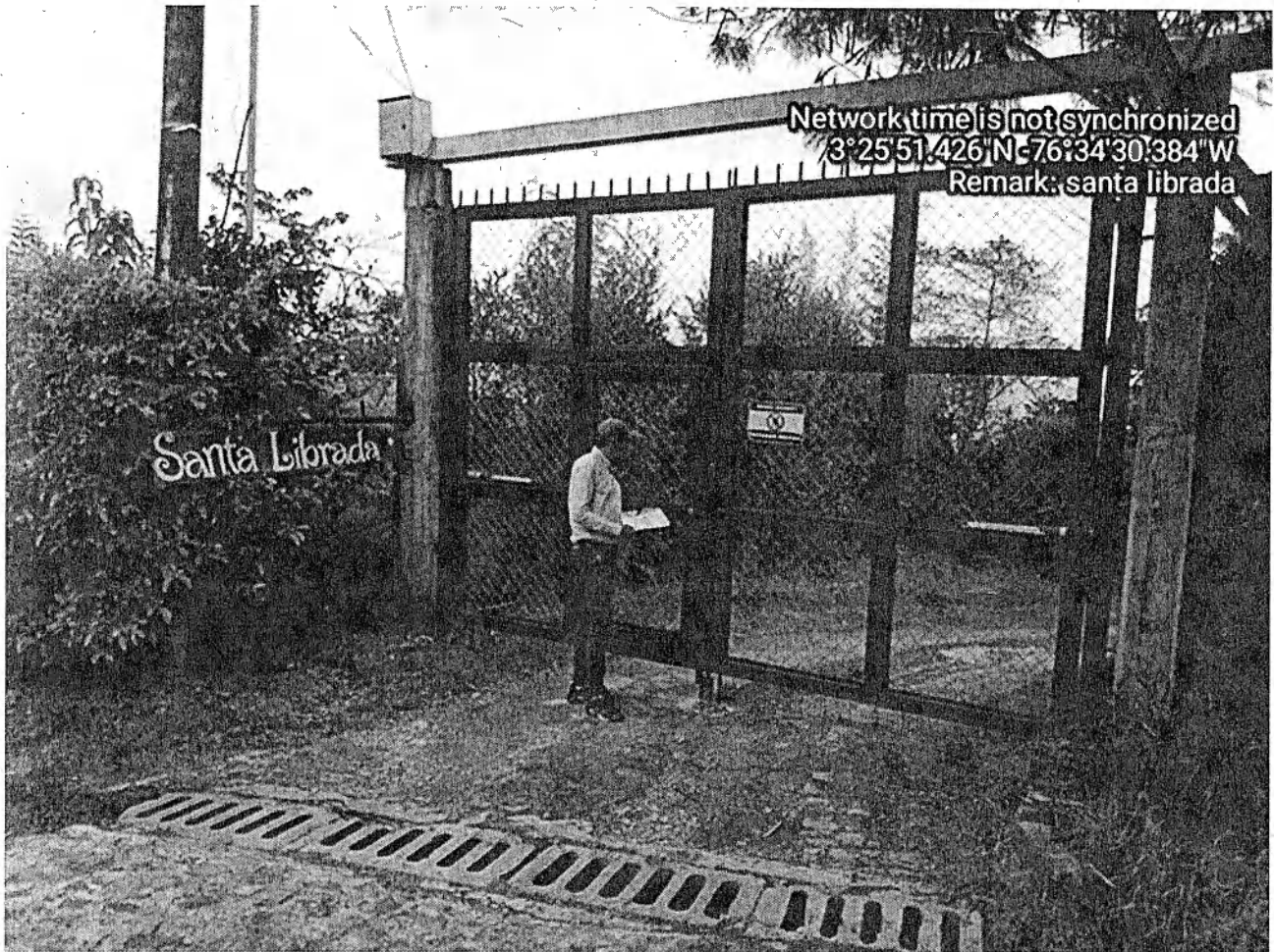
Fotografía 3: ubicación del predio Santa Librada

Por información de los vecinos; se nos informa que nadie atiende a los llamados que se hacen en ese sitio. Que hay una profesora que es compañera de los propietarios del predio y que ella nos puede dar razón.