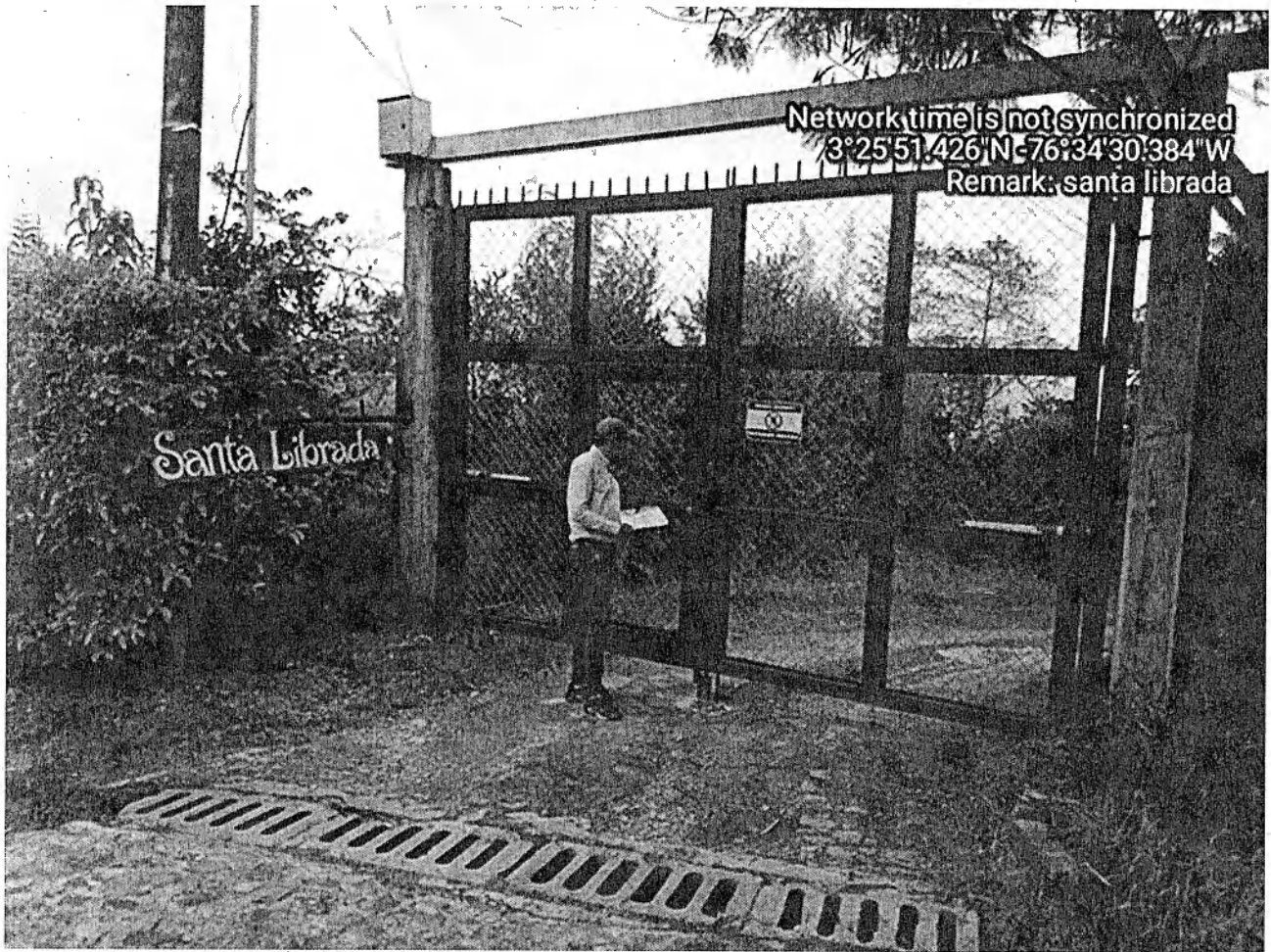
Fotografía 3: ubicación del predio Santa Librada

Por información de los vecinos; se nos informa que nadie atiende a los llamados que se hacen en ese sitio. Que hay una profesora que es compañera de los propietarios del predio y que ella nos puede dar razón.