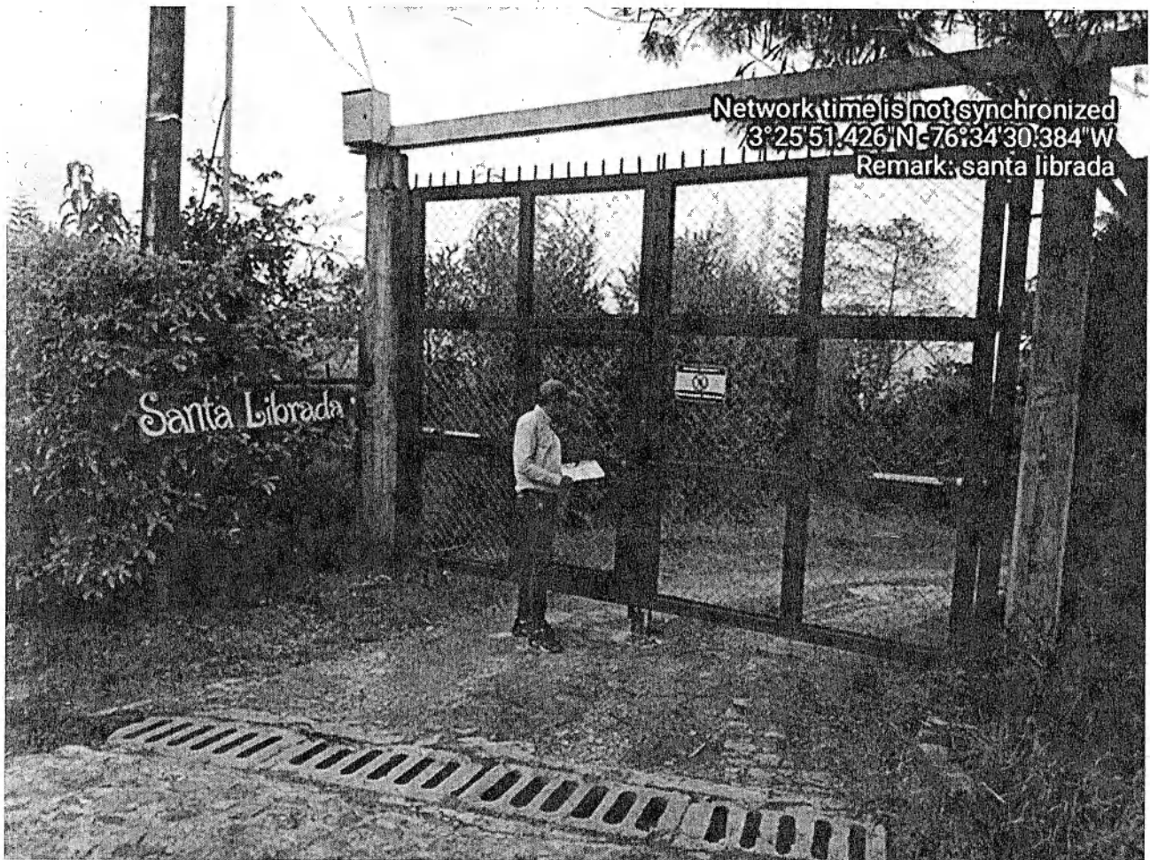
Fotografía 3: ubicación del predio Santa Librada

Por información de los vecinos; se nos informa que nadie atiende a los llamados que se hacen en ese sitio. Que hay una profesora que es compañera de los propietarios del predio y que ella nos puede dar razón.