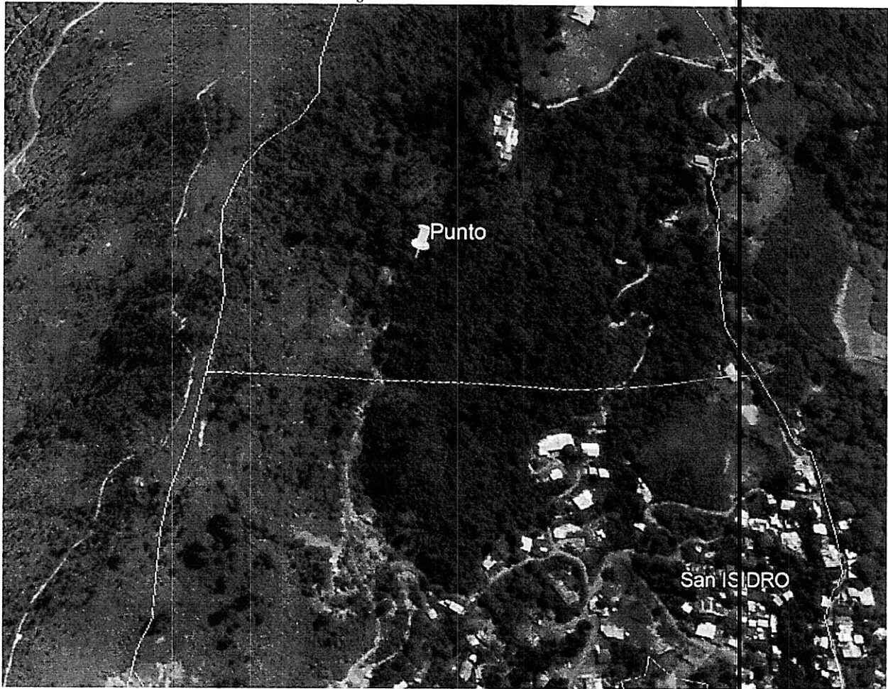
Imagen donde se muestra la ubicación del punto según coordenadas de los oficios, fuente Google Earth

Corporación Autónoma Regional del Valle del Cauca