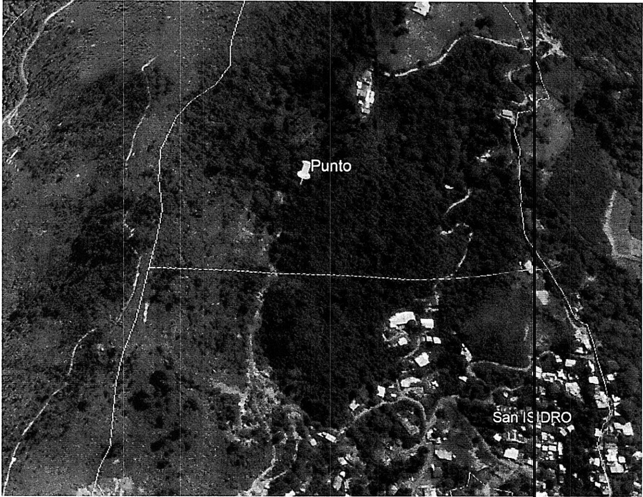
Imagen donde se muestra la ubicación del punto según coordenadas de los oficios

Corporación Autónoma Regional del Valle del Cauca