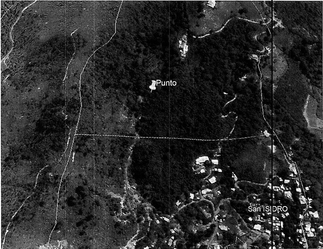
Imagen donde se muestra la ubicación del punto según coordenadas de los oficios

Corporación Autónoma Regional del Valle del Cauca