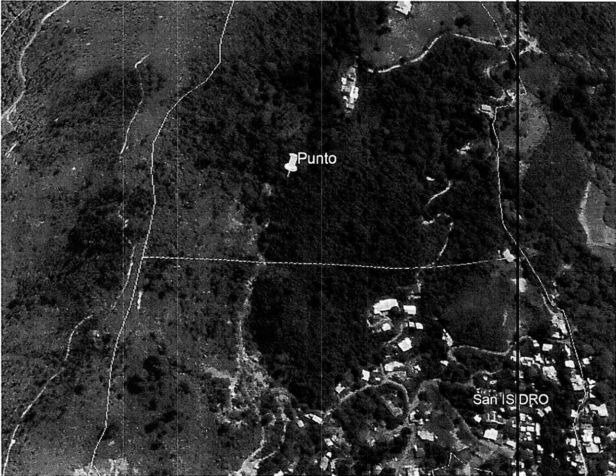
Imagen donde se muestra la ubicación del punto según coordenadas de los oficios

Corporación Autónoma Regional del Valle del Cauca