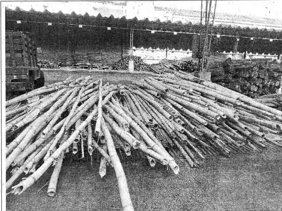
Figura 2. Material vegetal dispuesto en las Instalaciones Auxiliares de la CVC.