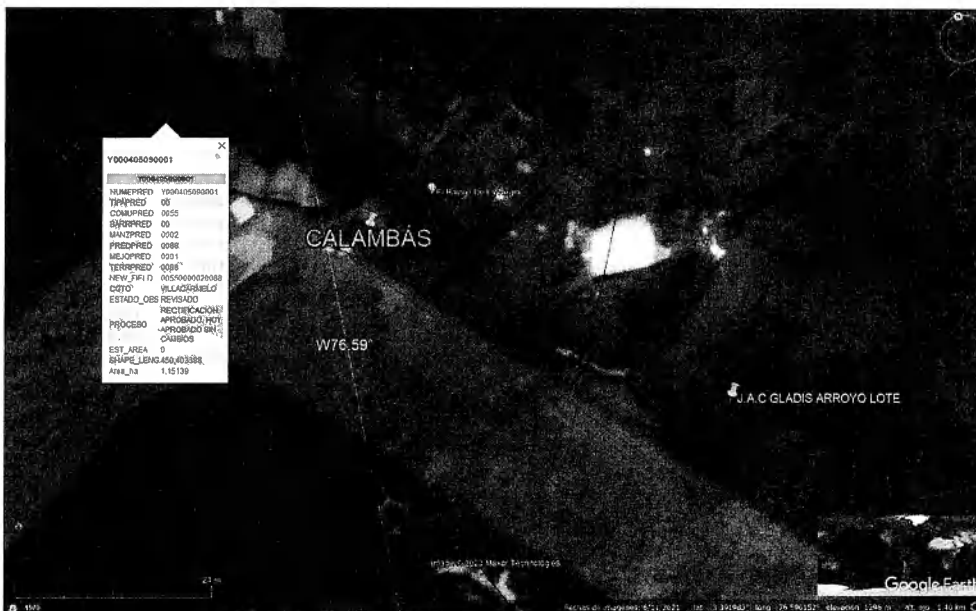
Fotografía 1: Ubicación predio El Balcón de la Negra, fuente: Google Earth 2023.