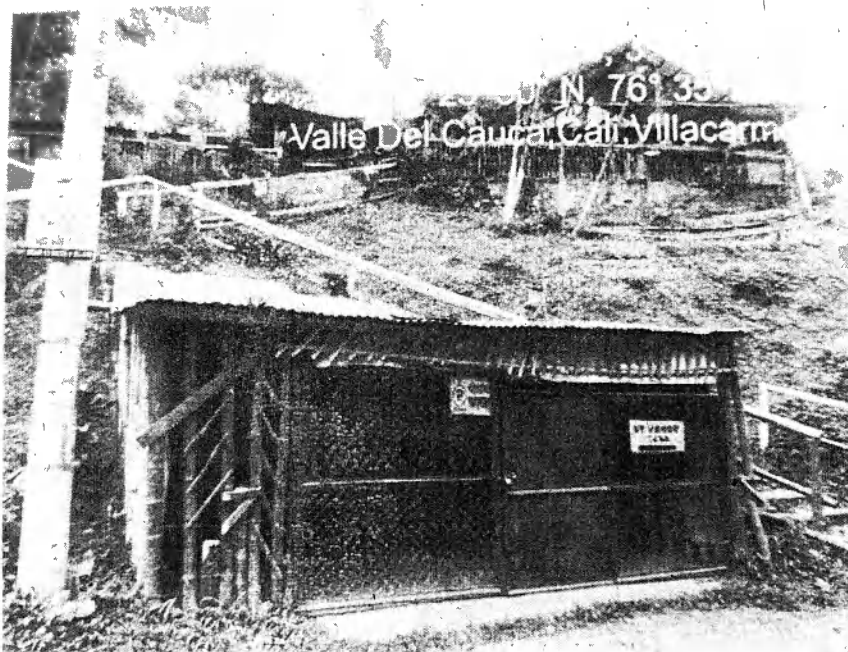
Fotografía 2: Construcción de muro y disposición de RCD, fuente propia 2022.

Mediante recorrido de control y vigilancia por el área de jurisdicción de la Unidad de Gestión de Cuenca Lili-Meléndez-Cañaveralejo, de la Dirección Ambiental Regional Suroccidente de la C.V.C, en la fecha indicada; se observó realizada visita técnica en inmediaciones de las coordenadas geográficas 3^{\circ} 23' 30.51'' N / 76^{\circ} 35' 23.81'' O, en el predio Balcón de la negra.