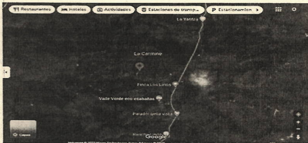
Ubicación satelital del predio La Aurora

Predio rural denominado La Aurora, vereda La Vigorosa, jurisdicción del municipio de Riofrio, Valle del Cauca; ubicación geográfica del predio La Aurora: Latitud 4°7'48.80"N y Longitud 76°20'53.60"O.