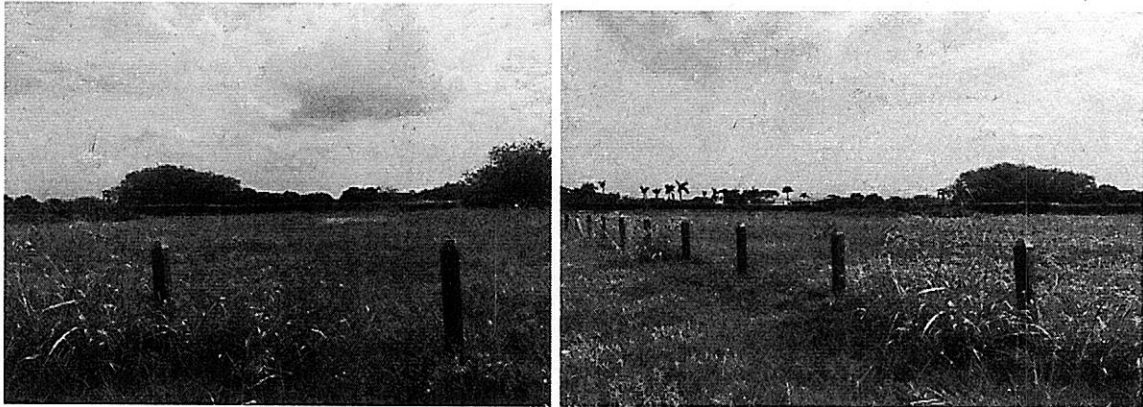
Imagen 1.2. Ubicación del lote deshabitado.

Se realiza visita con el fin de notificarle a los propietarios del predio lote, un oficio por medio del cual se inicia un procedimiento sancionatorio ambiental, en el recorrido no se pudo establecer comunicación con los dueños, ni personal que atendiera la visita; tampoco fue posible contacto vía celular. Se deja el registro fotográfico como evidencia de la visita.