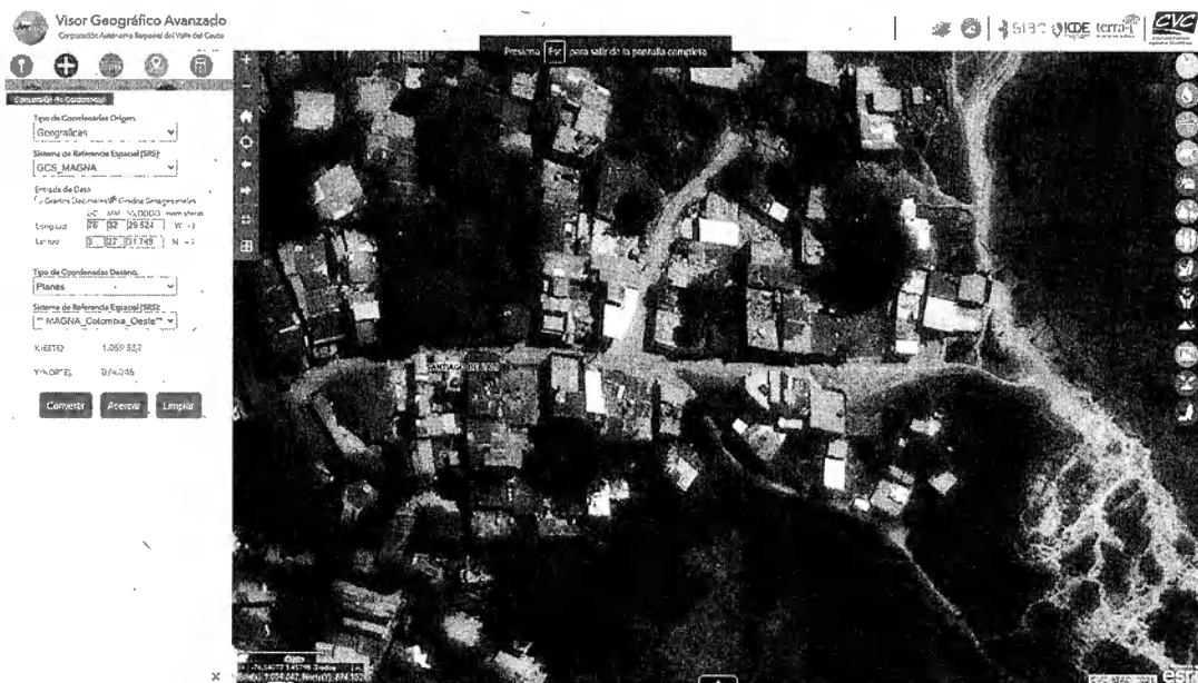
Mapa 1. Ubicación geográfica de la visita realizada.

Jurisdicción del Distrito de Cali, corregimiento de Golondrinas, Vereda Altos de Normadía, en las inmediaciones de las Coordenadas 3^{\circ}27'39.5''N 76^{\circ}32'43.6''W . (Planas X=1058125 Y=876133)