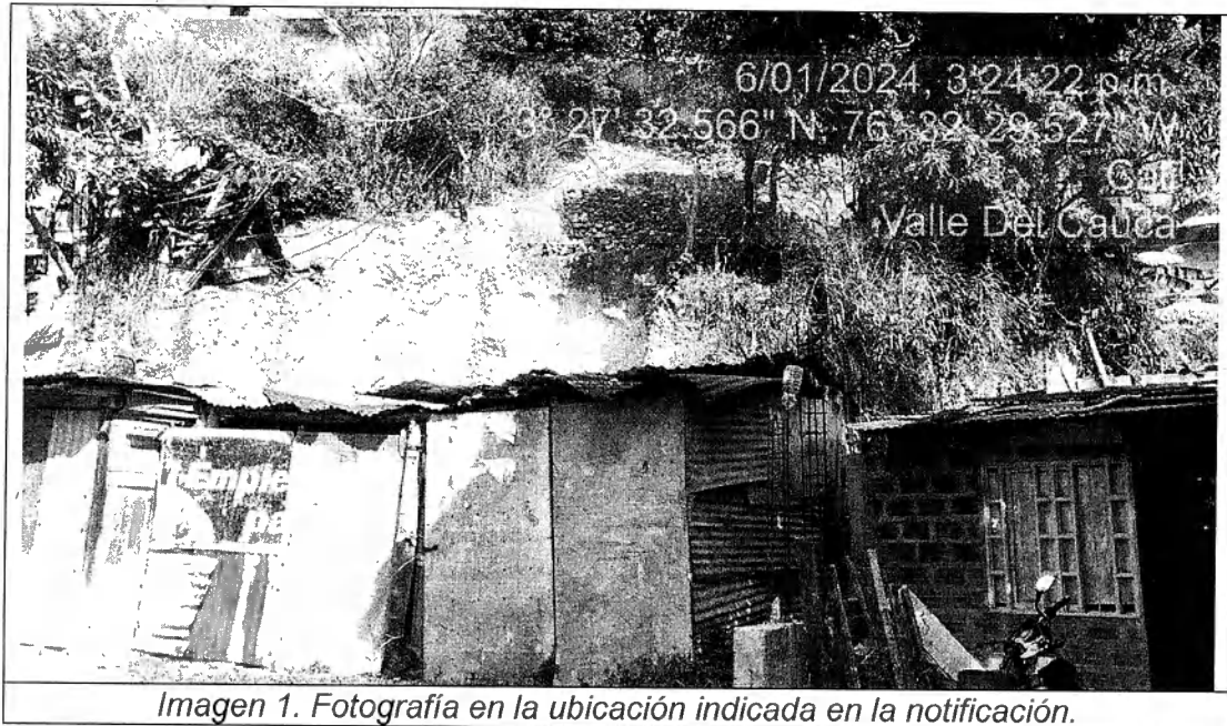
Imagen 1. Fotografía en la ubicación indicada en la notificación.

Corporación Autónoma Regional del Valle del Cauca