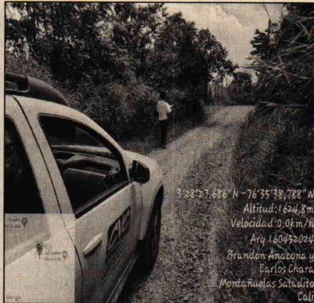
Fotos 1 y 2. Visita al sitio indicado en el oficio, en las coordenadas 1.053.738W, 875.970N, coordenadas geográficas 03°28'27.99"N, 76°35'38.01"W