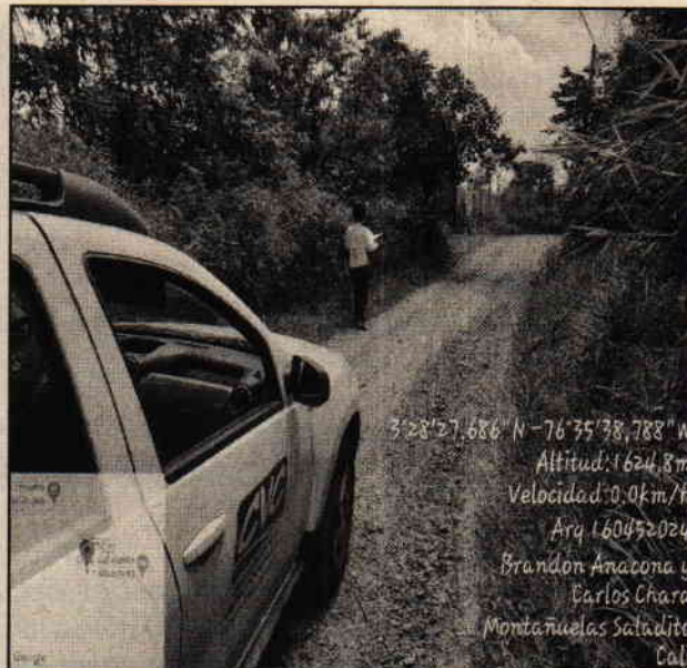
Fotos 1 y 2. Visita al sitio indicado en el oficio, en las coordenadas 1.053.738W, 875.970N, coordenadas geográficas 03°28'27.99"N, 76°35'38.01"W