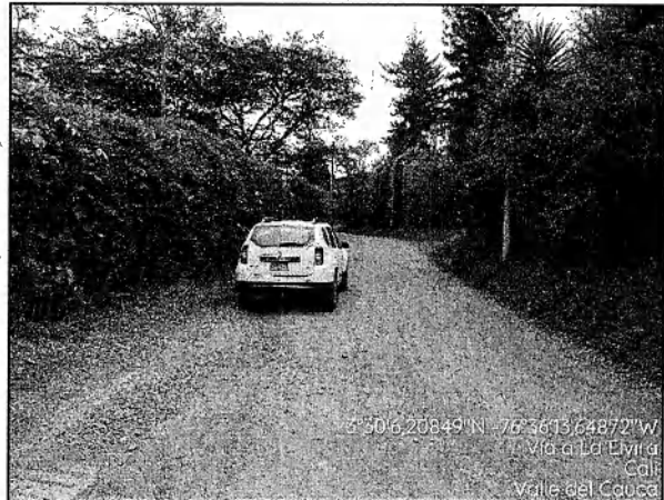
Fotos 1 y 2. Visita al sitio indicado con coordenadas 3°30'4.554" N, 76°36'12.751" W, entrada del predio