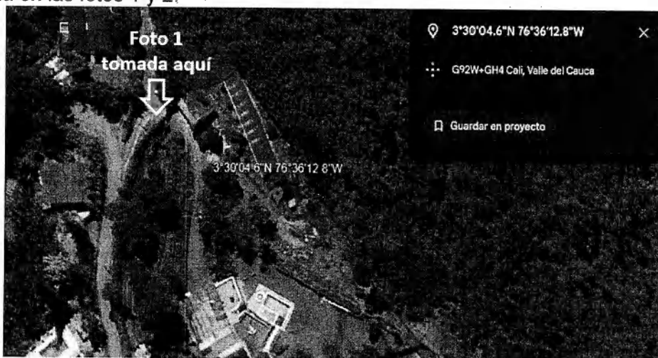
Imagen 1. Ubicación de coordenadas 3°30'4.554" N, 76°36'12.751" W en Google Earth y ubicación de la toma de las fotos 1 y 2

El día 10 de marzo de 2024 se realizó visita en vía al corregimiento de La Elvira, en las coordenadas indicadas en el ítem 4 del presente informe, cabe indicar que dichas coordenadas se ubicaron antes de realizar la visita en Google Earth así: 3°30'4.554" N, 76°36'12.751" W, lo anterior con el fin de poder llegar con más precisión al sitio; como dicha ubicación figuró dentro de un predio (ver imagen 1), se procedió a buscar en campo la entrada a dicho predio, la cual se evidencia en las fotos 1 y 2.