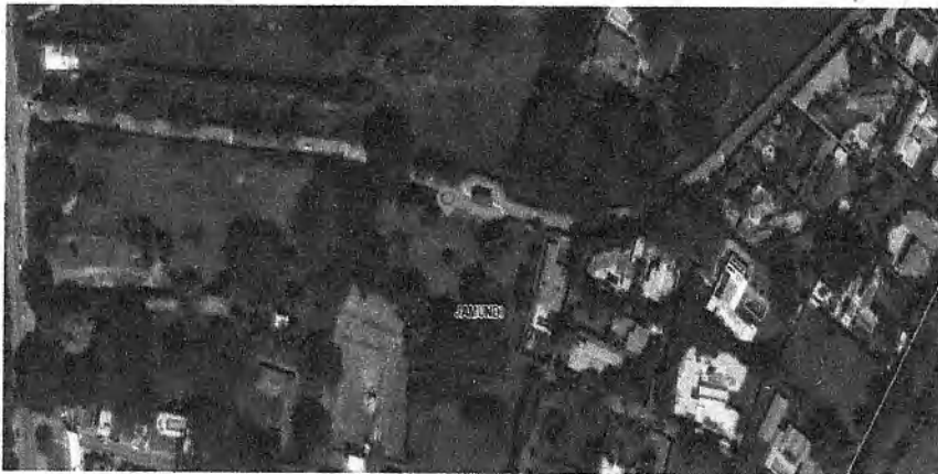
Imagen 1. Ubicación del condominio La Morada

Predio condominio Solares de la Morada Casa 5 etapa V y VI ubicado en Jamundí, en las coordenadas geográficas: 76°31'48,42" O 3°16'7,83" N