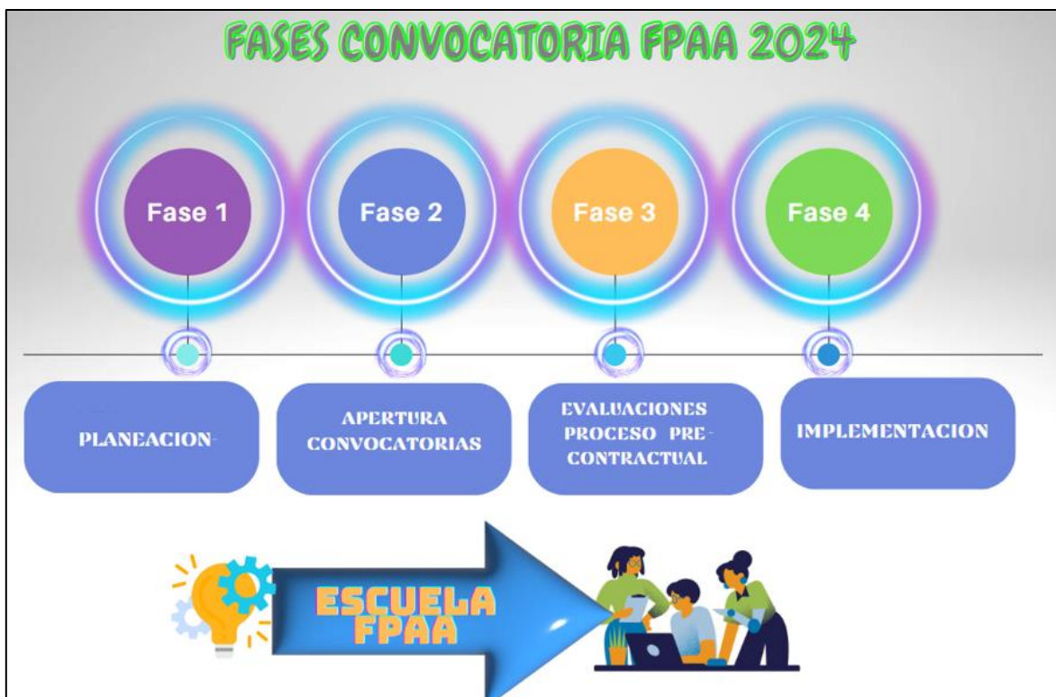
Gráfico 1. Etapas FPAA

El FPAA se desarrolla mediante 4 etapas en el transcurso de las vigencias: