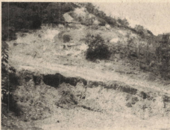
Cantera Las Peñas