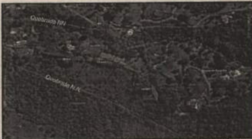
Localización del tramo carretable y las tres explanaciones de reciente construcción en el predio El Oasis.

"POR LA CUAL SE IMPONE UNA MEDIDA PREVENTIVA DE SUSPENSIÓN DE ACTIVIDADES Y SE TOMAN OTRAS DETERMINACIONES."