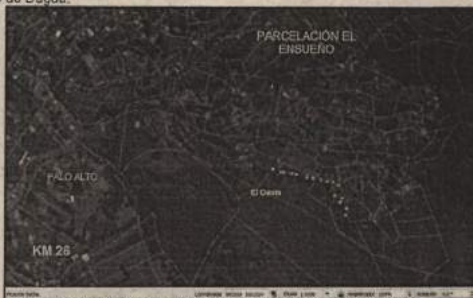
Mapa 1 Vista en planta, localización del predio El Llano.

Predio denominado El Oasis, identificado con matrícula inmobiliaria No. 370-775885, con número de Referencia Catastral Anterior: 76233000200021634000, localizado en el Corregimiento de Borrero Ayerbe sector de la finca Palo Alto en el KM 26 de la vía Cali-Dagua, jurisdicción del municipio de Dagua.