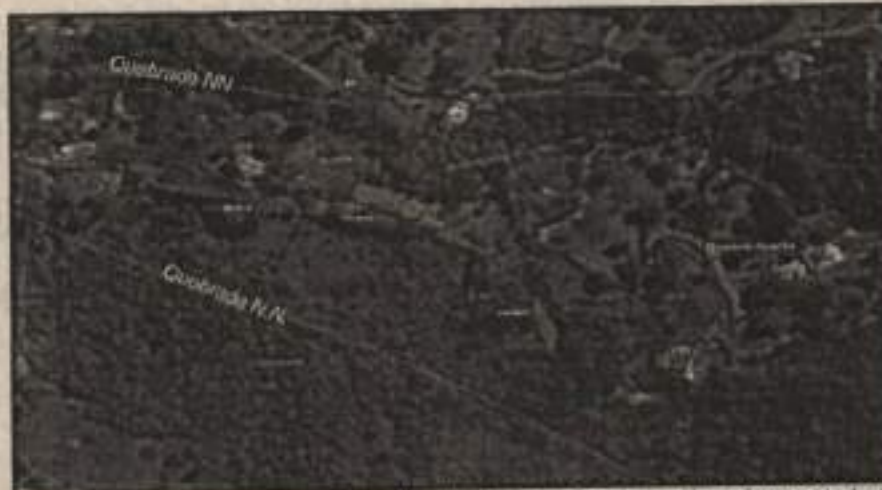
Localización del tramo carretable y las tres explanaciones de reciente construcción en el predio El Oasis.

"POR LA CUAL SE IMPONE UNA MEDIDA PREVENTIVA DE SUSPENSIÓN DE ACTIVIDADES Y SE TOMAN OTRAS DETERMINACIONES."