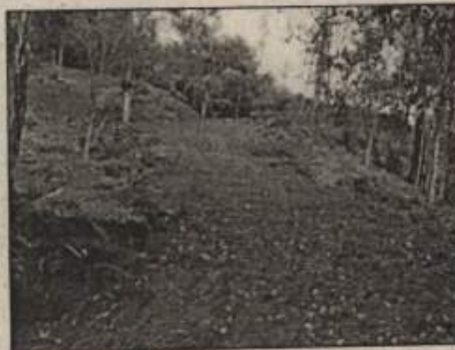
Registro fotográfico de las explanaciones de reciente construcción.

"POR LA CUAL SE IMPONE UNA MEDIDA PREVENTIVA DE SUSPENSIÓN DE ACTIVIDADES Y SE TOMAN OTRAS DETERMINACIONES."