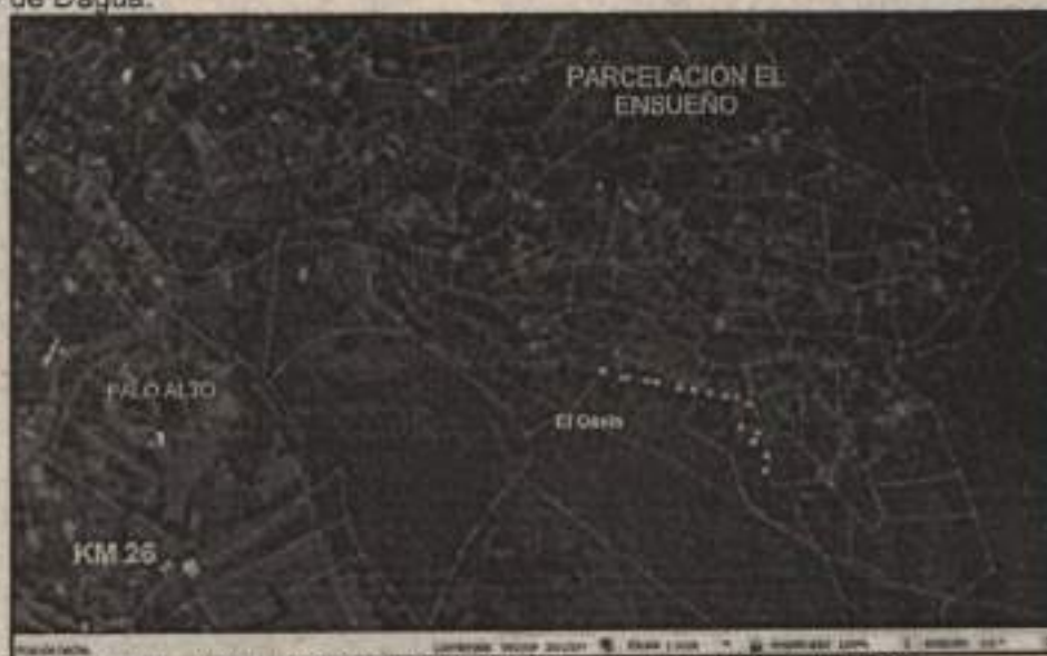
Mapa 1 Vista en planta, localización del predio El Oasis.

Predio denominado El Oasis, identificado con matrícula inmobiliaria No. 370-775885, con número de Referencia Catastral Anterior: 76233000200021634000, localizado en el Corregimiento de Borrero Ayerbe sector de la finca Palo Alto en el KM 26 de la vía Cali-Dagua, jurisdicción del municipio de Dagua.