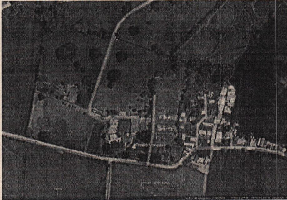
Figura 1. Predio "El Paraíso" – Fuente: Google Earth

Corporación Autónoma Regional del Valle del Cauca