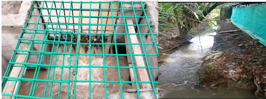
Registro No 2 y 3 sitio donde se hace la regulación del recurso con tabloncillos para evitar inundaciones y acequia del afloramiento en el predio.