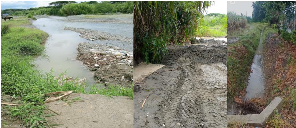
Registro No 2,3 y 4 de donde se hace la captacion del rio Tuluá para el predio el Cairo.

La diligencia de visita ocular se realizó el día 16 de abril de 2026 en compañía del señor Andrés Felipe Fernández, con cedula de Ciudadanía No 1.113.040.481 mayordomo de la empresa PRODUCCIONES CAVI, El predio Cairo se encuentra ubicado en la vereda los Caímos municipio de Agua Clara ,municipio de Tuluá posee un área total de 294,4 Has el uso actual es agrícola para irrigación de cultivo de caña de azúcar donde se hace la toma para riego por gravedad a través de una bocatoma en el lecho del rio Tuluá, a través de canal abierto. Como aparece en el registro fotográfico. No 2,3 y 4, en la actualidad cuenta con concesión de aguas superficial de uso público según resolución RESOLUCION 0730 No. 0731 - 106 DE 2025 (13 DE ENERO DE 2025), contentiva en el expediente 0731-010-002-350-2003. Cuya asignación es de 30 L/seg. (TREINTA PUNTO CERO LITROS POR SEGUNDO), se realizó la georreferencian del punto de captación encontrándose con las siguientes coordenadas Geográficas: 4° 06' 33,23" de latitud Norte y 76° 12' 1,70" de longitud Oeste.