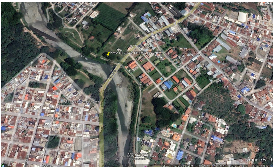
Registro 1 ubicación del predio el Cairo

Predios denominados San José y el Cairo, con matrícula inmobiliaria No. 384-12071, y 384-3985 ubicados en la vereda Los Caímos, corregimiento Agua clara, jurisdicción del municipio de Tuluá, departamento del Valle del Cauca. Ubicado en las coordenadas 4°06' 33,23" N - 76° 12' 1,70" W, altura 9.56.m. s. n. m.