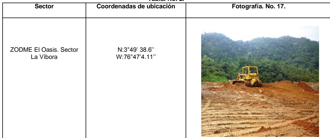
Tabla. No. 2.

El tramo del cauce inspeccionado en el informe de soporte del presente concepto donde se realizó un recorrido desde aguas abajo de la desembocadura de la quebrada peñalisa, hasta ciento cincuenta metros aguas arriba del área anteriormente intervenida, muestra un cauce sin desvío del flujo, no presenta obstrucción o reducción de la sección