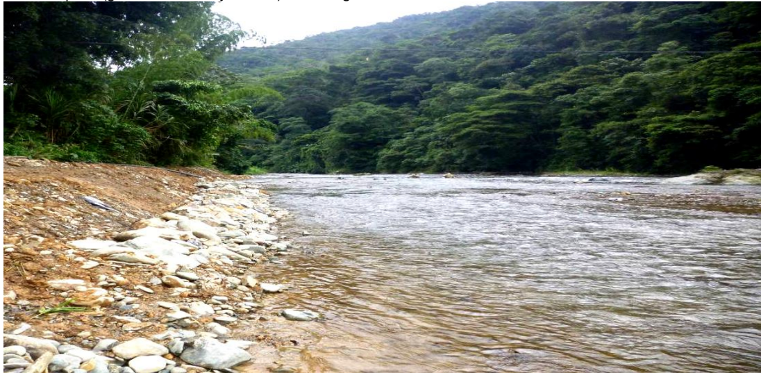
Fotografía. No. 2. Se observa el estado actual del cauce y márgenes luego del retiro de los materiales de excavación, no se presenta colmatación o desvío del flujo.

Descripción de la situación: Teniendo en cuenta la información que reposa en el informe de visita del 07 de marzo de 2016. Tramo río Dagua, vereda Peñalisa ubicadas en el kilómetro 41.8 de la vía Cabal Pombo, Cuenca media del río Dagua, Distrito de Buenaventura. Se verificó el cese de las actividades de disposición de materiales producto de excavación en la margen y cauce del río Dagua, sector Peñalisa. Se comprobó el retiro de los materiales producto de excavación que se encontraban en el cauce y margen del tramo río Dagua sector Peñalisa. No existen evidencias de inundaciones o rebosamiento por obstrucción de los materiales producto de excavación que se encontraban anteriormente en el cauce y margen, la margen derecha no presenta deslizamiento o pérdida de la conformación aluvial, se presenta una sección hidráulica que permite un flujo normal de la corriente, no se presenta turbiedad en la carga de lavado, la carga de fondo está constituida por materiales aluviales provenientes de los procesos erosivos de la formación raposo (gravas, arenisca y arcillas). Ver fotografía. No. 2.