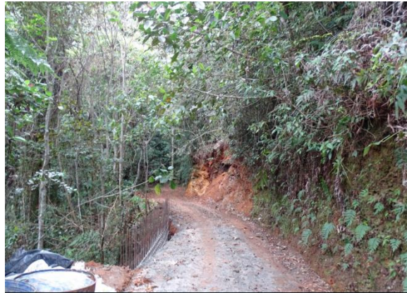
Muro en concreto