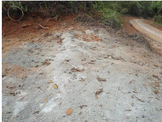
PARAJE No 15: Existe dos pequeñas bahías que suman 30 metros cuadrados y un tramo de huellas, aquí se autorizó mediante hoja control de visitas cortar un árbol de especie cedrillo de 12 metros de altura ubicado en el talud de la vía, árbol que amenaza con volcamiento ofreciendo peligro para transeúntes. Se afectaron adicionalmente 3 árboles por movimiento de tierras.