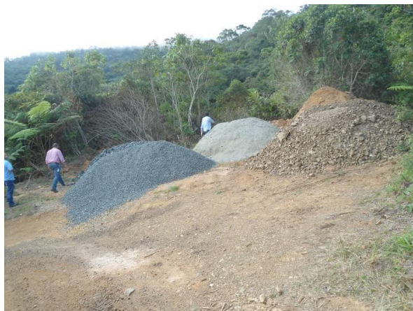
PARAJE No 4: Bahía de descargue construida con maquinaria pesada con área 30 metros cuadrados.