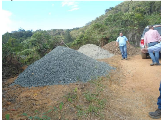
PARAJE No 6: Bahía de descargue construida con maquinaria pesada con área 60 metros cuadrados, se observó el volcamiento de un árbol de Yarumo de aproximadamente 8 metros de altura, como consecuencia del movimiento de tierra.