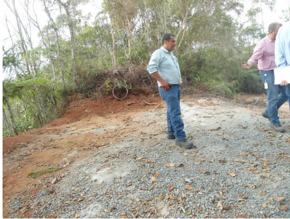
PARAJE No 14: Inicio de huella para luego encontrar una bahía donde existe triturado y arena con un área de 120 metros cuadrados.