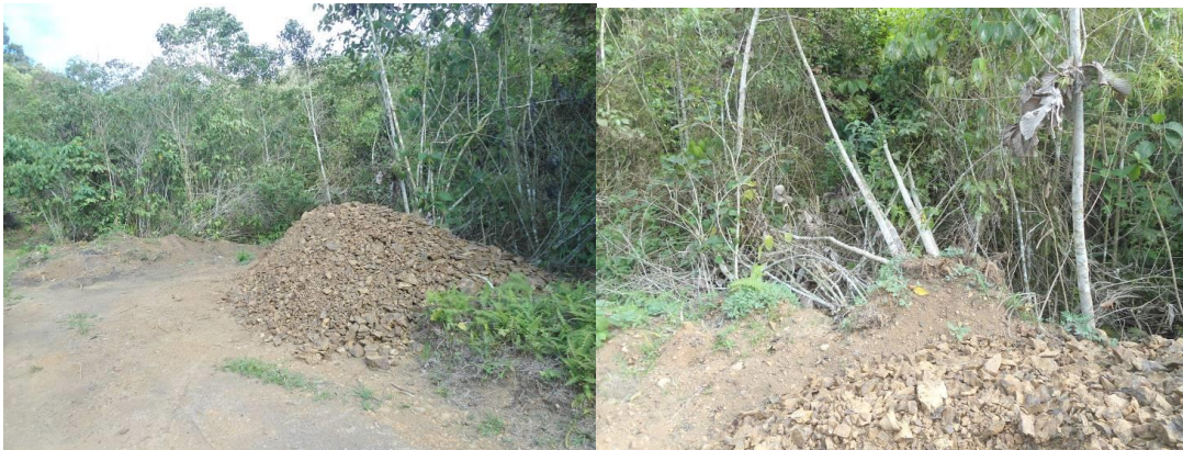
PARAJE No 7: Se está construyendo un muro en concreto de 6,40 metros de largo por 20 centímetros de ancho y 2.10 metros de altura, igualmente se apreció movimiento de suelo sobre la base del talud de la vía a margen izquierdo subiendo, en donde se desestabilizó el talud en zona de falla por movimiento de tierras, lo cual ha generado un escenario de amenaza por fenómenos de remoción en masa. Durante la visita se recomendó la erradicación de un árbol cuya raíz quedó en el aire.