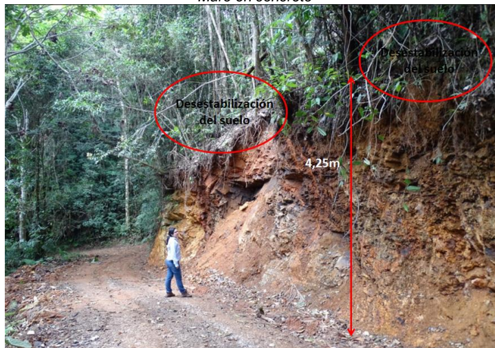
Desestabilización de talud en zona de Falla.