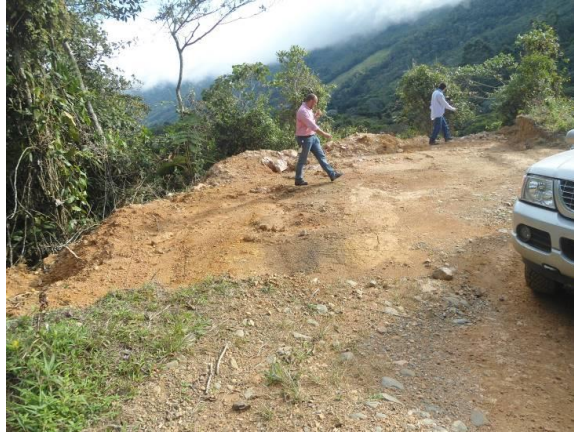
PARAJE No 5: Bahía de descargue construida con maquinaria pesada con área 78 metros cuadrados, con presencia de arena, roca muerta, en este lugar se afectaron 3 árboles los cuales no fue posible identificar.