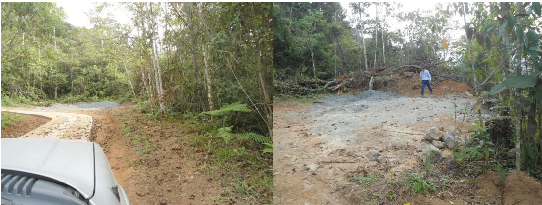
PARAJE N° 16 Se midió con decámetro un tramo en donde se instaló las placas huellas y ciclópeo, en su totalidad se encuentra en zona de Reserva Forestal Cerro Dapa Carisucio, el tramo corresponde a una longitud de noventa y un metro (91m) ver mapa.