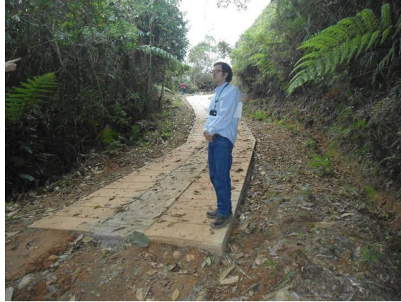
Huellas en RFPN Cerro Dapa Carisucio